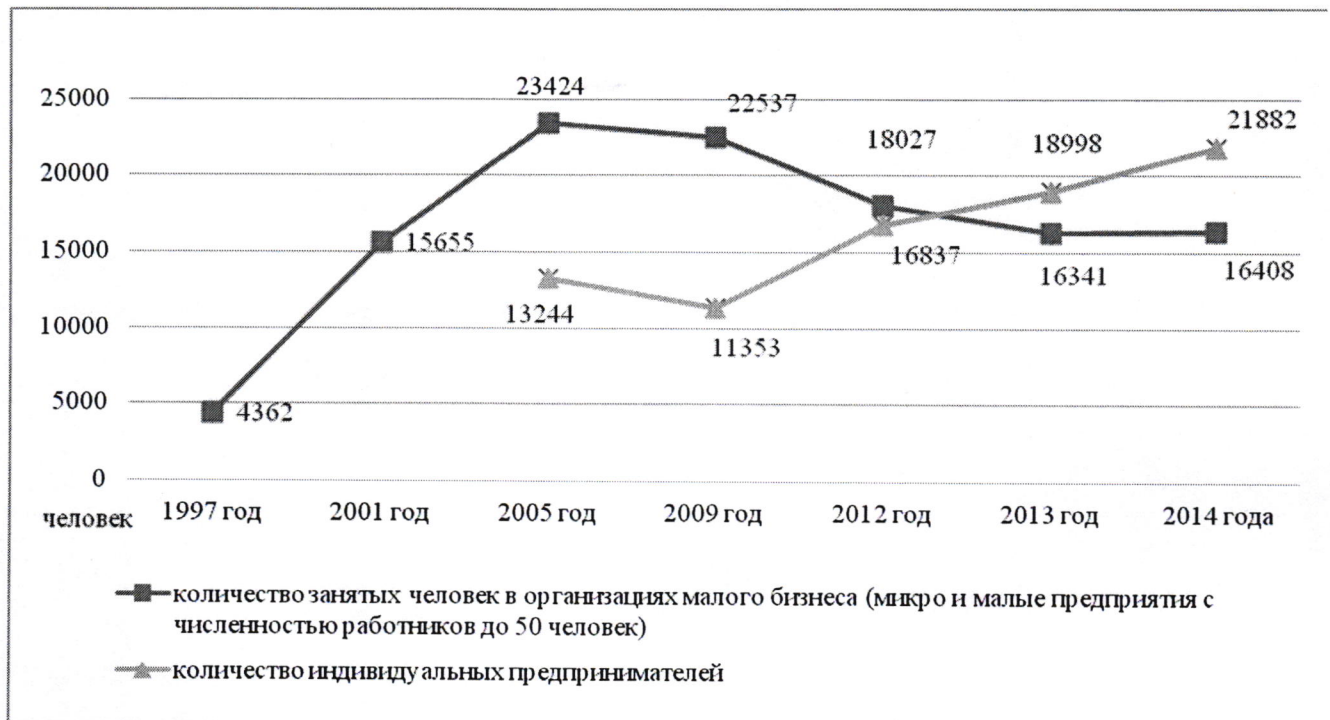
Количество занятых человек в сфере малого предпринимательства

Полученные данные свидетельствуют об увеличении занятых в сфере малого предпринимательства, однако это увеличение за последние годы происходит в основном за счет роста количества индивидуальных предпринимателей. Большинство людей, изъявивших желание заняться предпринимательством, выбирают именно деятельность на основе индивидуального предпринимательского патента ввиду того, что она является простейшей формой осуществления предпринимательской деятельности и не требует ведения бухгалтерского, финансового и статистического учета, применения контрольно-кассовой техники и представления информации о полученных доходах.